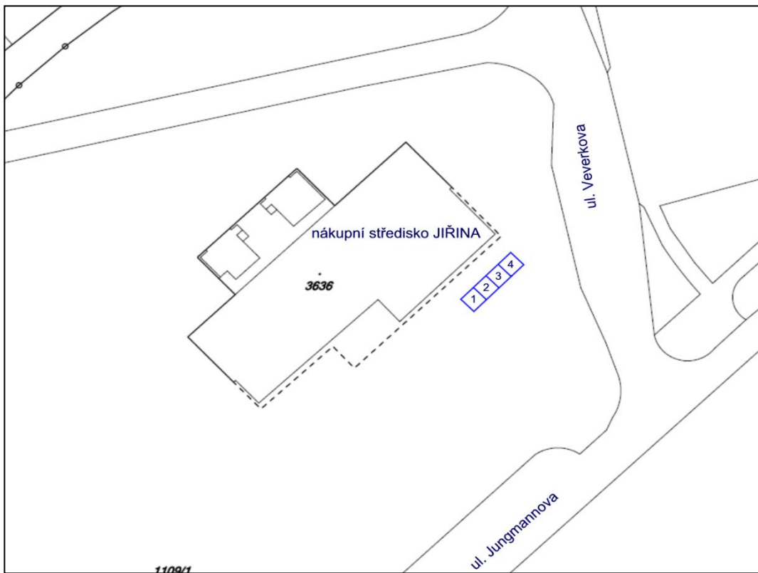
obrázek č. 4 tržiště u nákupního střediska Jiřina