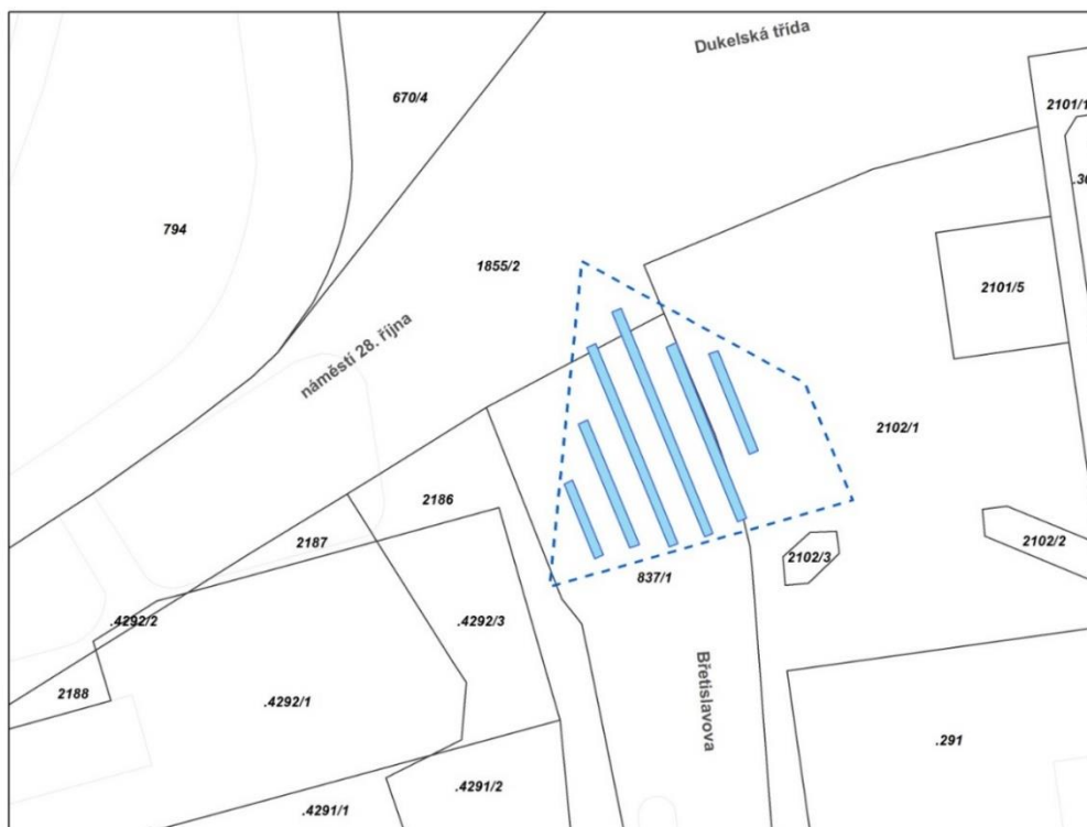
obrázek č. 1 městská tržnice na náměstí 28. října